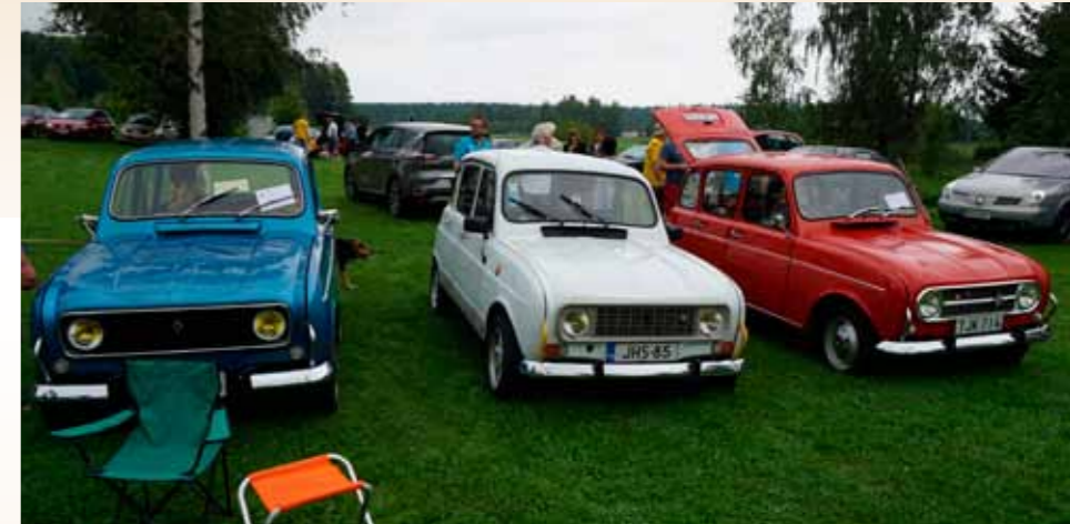
Tricolorin värit by Tipat.