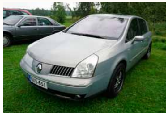
Harvemmin tulee liikenteessä vastaan: Vel Satis.

asti. Välillä oli toki yritettävä keksiä vastauksia järjestäjien kyhäilemiin kysymyksiin ja kuva-arvoituksiin. Tämänkin vuoden tietoviisas löytyi ja oli palkintonsa ansainnut. Pääasia oli kuitenkin tutustuminen paikallisiin asioihin ja Lautsian historiaan.