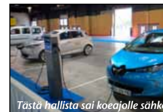
Tästä hallista sai koeajolle sähköautoja.