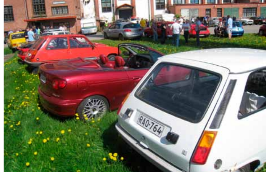
Tässäpä sitä ovat vierekkäin pläypoi-kiituri ja arkiset, nyt jo kunnioitettavaan ikään ehtineet käyttöpuurtajat.