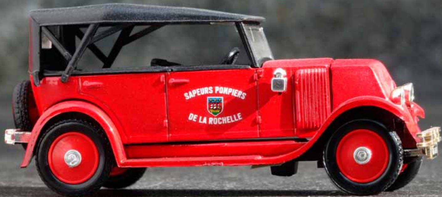
Teksti ja kuvat Kari Kittä

Nämä kaikki pienet ja punaiset eivät taida varsinaisesti olla paloautoja, mutta ainakin palo- ja pelastuslaitoksen kulkuneuvoja. Ranskanmaalla paloautojen kyljistä kun löytyy monenmoista tekstiä, sitten on vielä punaiset SAMU-sairaankuljetusautot, jotka ovat myös osa pelastuslaitosta. Taidan nyt kuitenkin nimittää näitä kaikkia paloautoiksi, suurin osahan niistä on kuitenkin palopäällikköiden autoja.