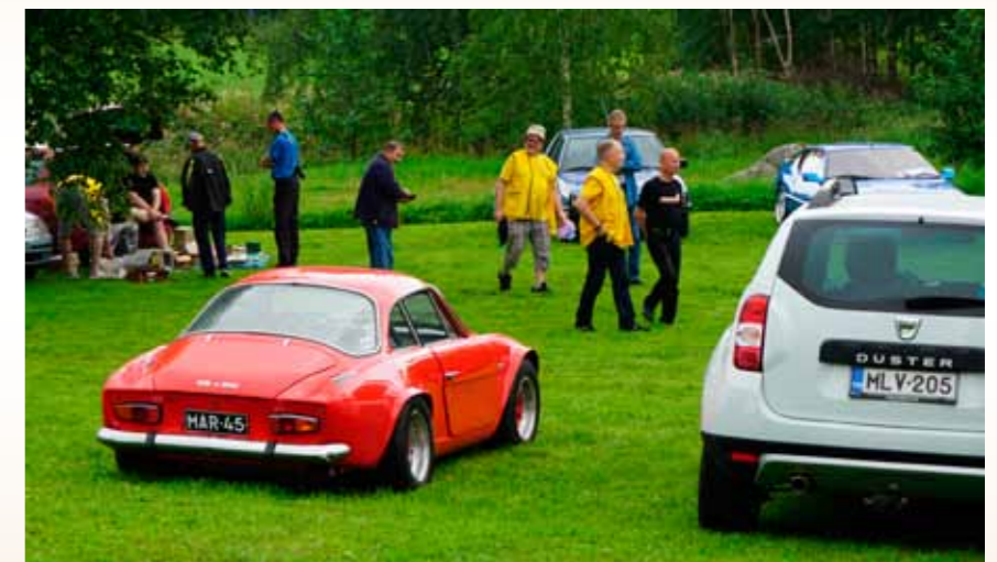
On se vaan pieni ja matala!