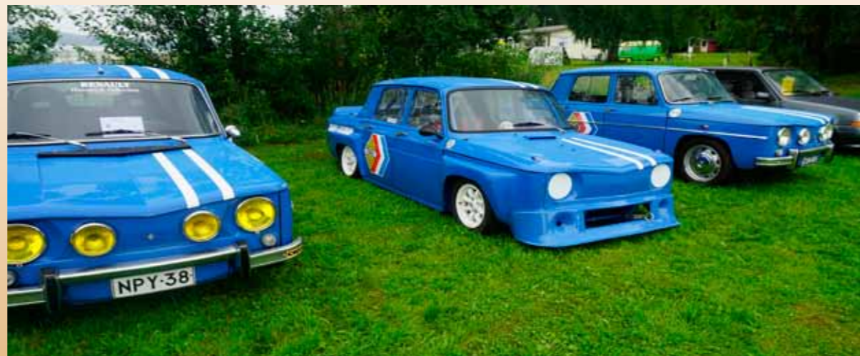
Ja tässä sitä sinisempää kalustoa. Aivan upeita Relluja kaikki!