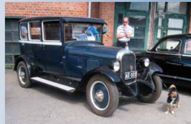
Varmaankin tämän vuoden visiitin vanhin auto. Citikka, malli ei tiedossa.