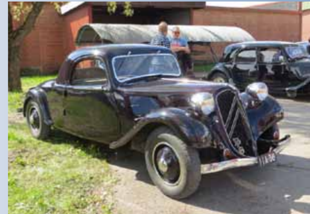
Aikakautensa sulavalinjaista coupe-tyyliä, Citroen Traction Avant B11 A,vm. 1936. Wow!