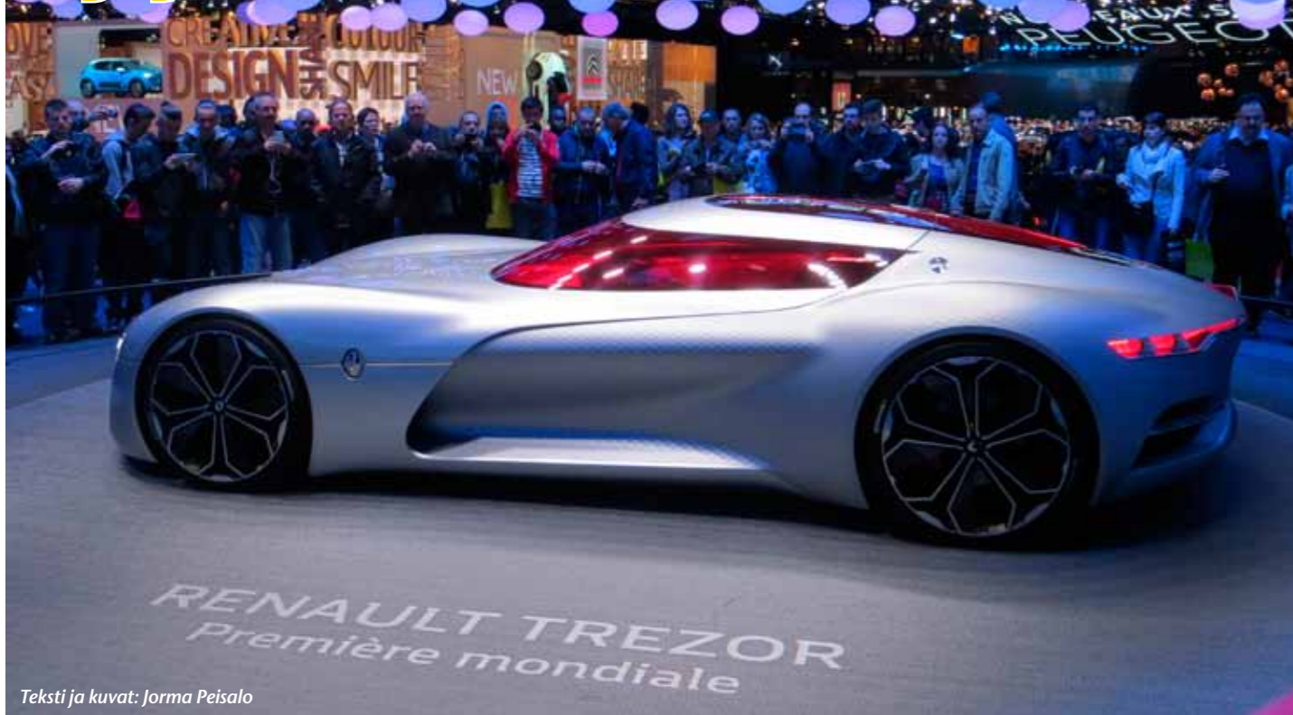
Teksti ja kuvat: Jorma Peisalo

Kesälomasta jätettiin pitämättä muutama päivä sillä ajatuksella, että käydään syksyllä Pariisissa katsomassa autonäyttelyä ja tietysti kaupunkia muutenkin.