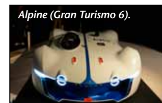
Alpine (Gran Turismo 6).