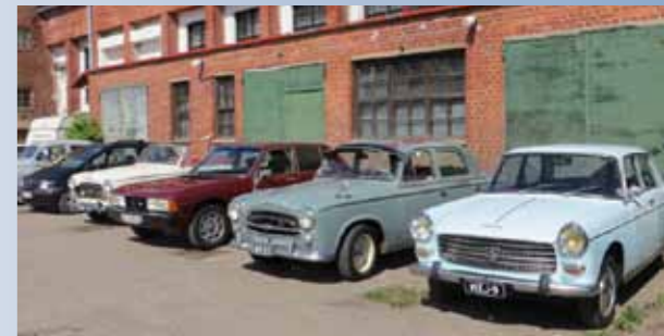
Coupe-Pösöjä oli paikalla tosi monta! Kuvassa niistä vain osa. Osa tuunattuja, osa originaaleja.