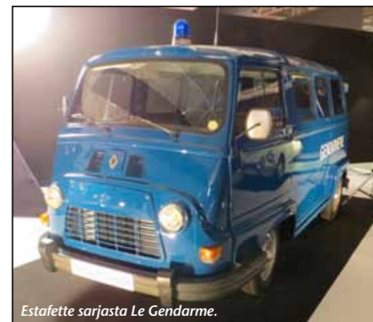
Estafette sarjasta Le Gendarme.

Viisi päivää vierähti nopeasti ja lentokentän junassa alkoikin jo keskustelu siitä, että tullaanko katsomaan Retroa helmikuussa. Ajatus on jätetty hautumaan.