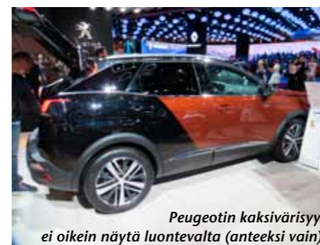
Peugeotin kaksivärisyys ei oikein näytä luontealta (anteeksi vain).