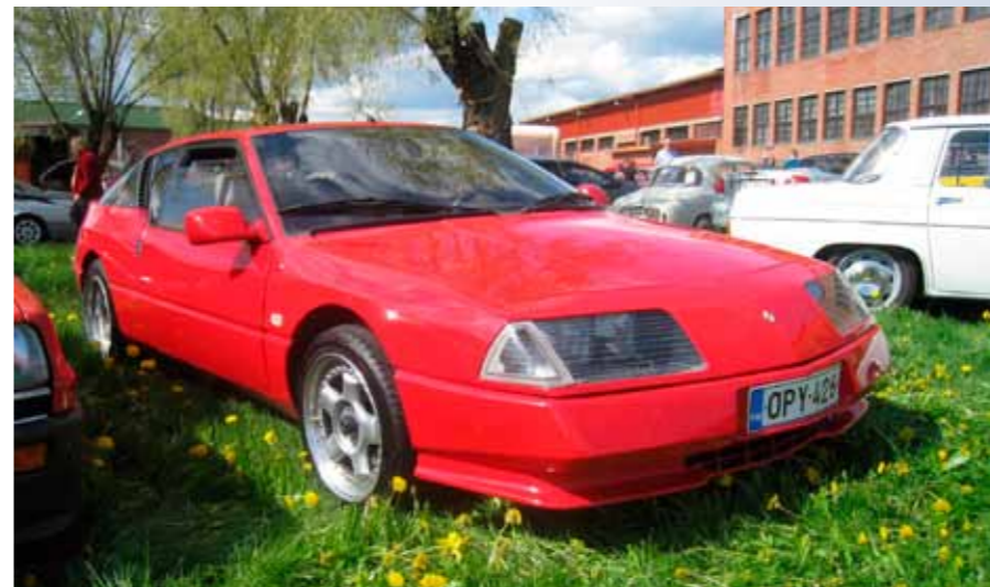
Kyllä kinkku on joulupöydän kunkku, ja Alpine on kokoontumisten prinsieversti!