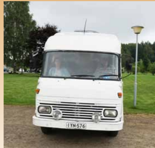
Sieltä raskaammasta päästä....

Entistä upeampia entisöintejä tupsahtelee harras-