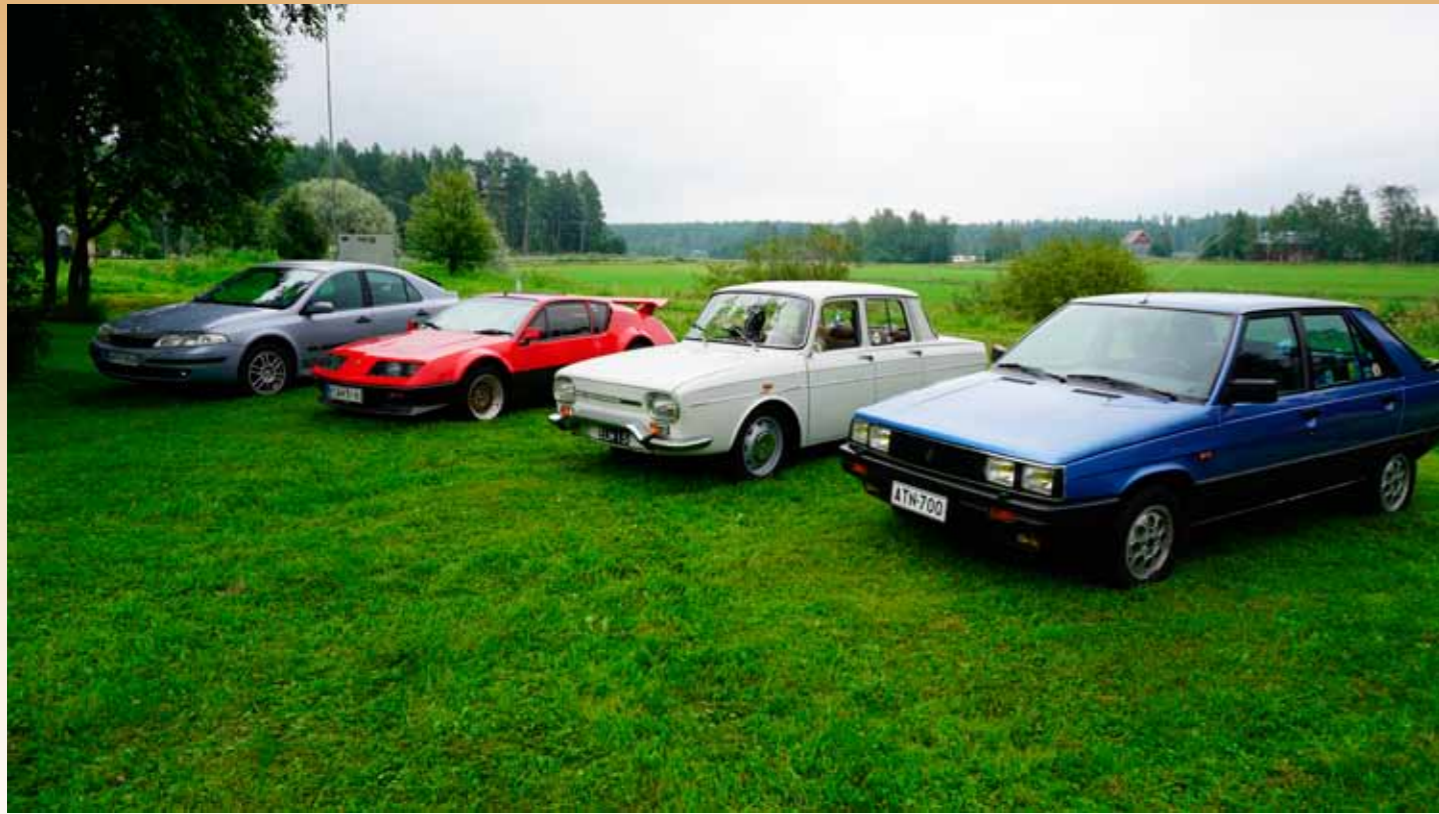
Vauhtia ja tyyliä samassa rivissä.