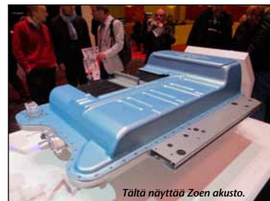
Tältä näyttää Zoen akusto.

Hieman eläväisempää menoa oli sitten tarjolla Montmantren kukkulalla, sillä siellä sattui olemaan sadonkorjuujuhlat. Aluetta joskus kiertäneet ovat saattaneet nähdä siellä olevat viiniköynnökset ja todellakin, niistä myös tehdään viiniä! Tuotos on peräti