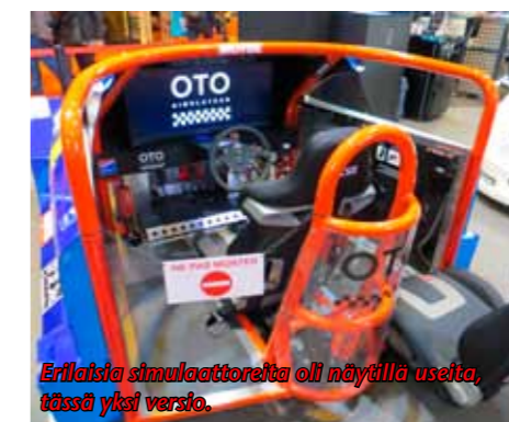
Erlaisia simulaattoreita oli näytillä useita, tässä yksi versio.