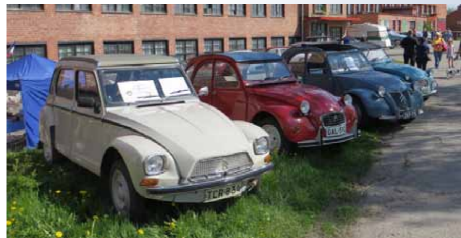
Tämä mallisto se on aina yhtä zympaattista, ainakin kirjoittajan mielestä.