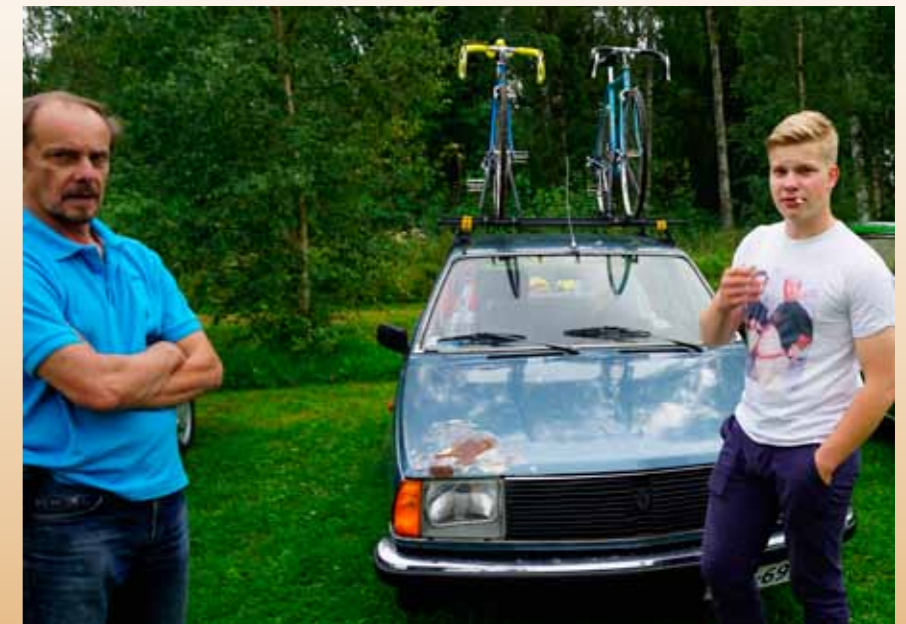
Tour de France -tyyllillä.