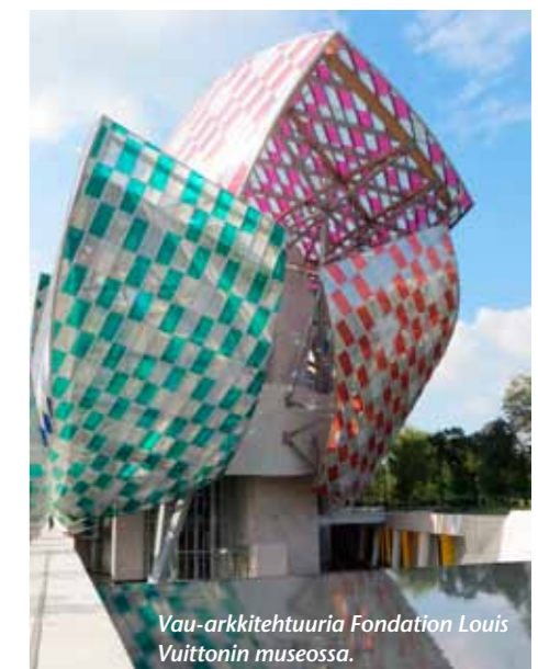
Vau-arkkitehtuuria Fondation Louis Vuittonin museossa.