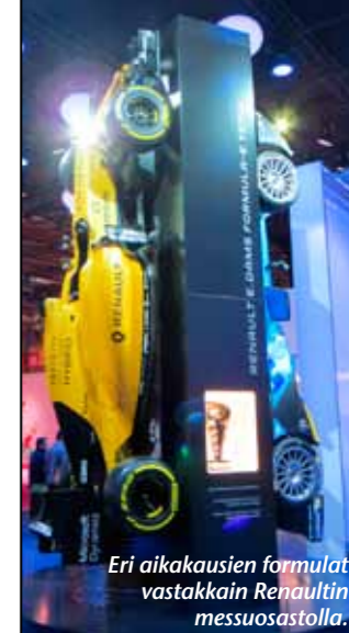
Eri aikakausien formulat vastakkain Renaultin messuosastolla.