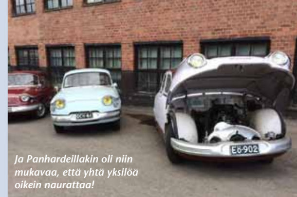
Ja Panhardeillakin oli niin mukavaa, että yhtä yksilöä oikein naurattaa!