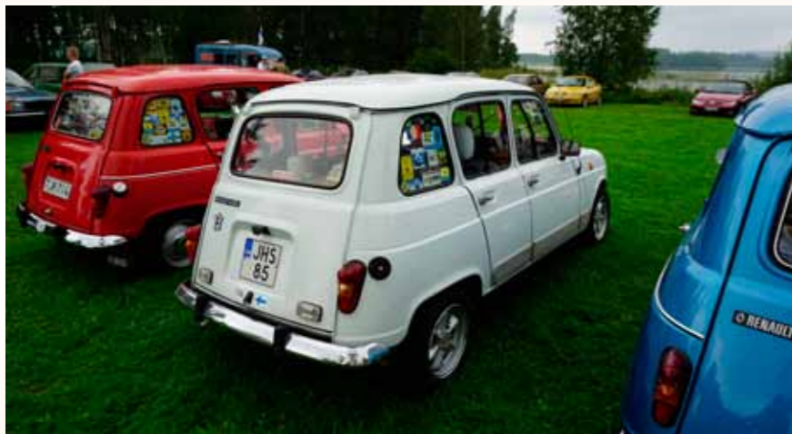
Siinä on tarra poikineen takalasisa.